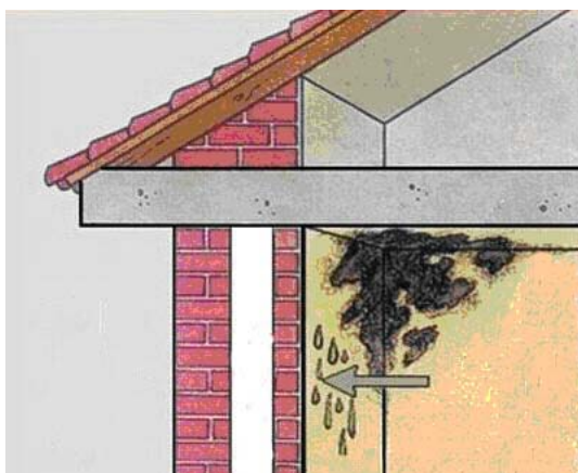
Figura 1-2 – Formazione delle condense.

Molti sono i fattori di interesse pratico che, nella vita di tutti i giorni, sono connessi alla presenza di umidità nell'aria che ci circonda. Ulteriori esempi sono costituiti dalla formazione di condense, nonché dall'essiccamento delle pareti o del bucato. Siamo soliti infatti osservare in giornate o ambienti molto umidi (bagni, cucine) sia la presenza di fastidiose condense, che se persistono possono dar luogo a inestetiche e insalubri muffe, sia all'allungamento dei periodi di asciugatura del bucato. La brava massaia sa bene che per evitare tali fenomeni occorre ventilare frequentemente questi ambienti soprattutto nelle giornate secche, oppure mantenere per quanto possibile calde le superfici su cui la condensa si manifesta (Figura 1-2).