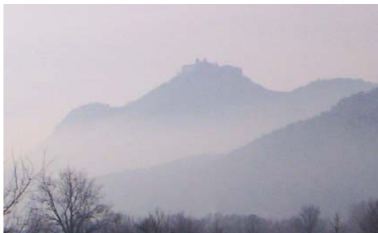
Figura 1-1 – La nebbia: abbazia di Montecassino (Cassino, FR).

suolo è più bassa oppure su superfici umide quali stagni, paludi, corsi d'acqua, fiumi.