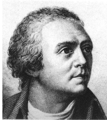
Figura 1-5 - Horace Benedict de Saussure.

Importanti cambiamenti si ebbero a partire dal 1790, quando Andrea Deluc stabilì che il vapor d'acqua ha le stesse proprietà dei gas ed il prodotto dell'evaporazione di un liquido possiede la sua stessa natura. Egli, inoltre, osservò come la presenza di vapore, da solo e mescolato con aria, determini un incremento di pressione, rilevabile attraverso un manometro, ed un incremento di umidità, rilevabile attraverso un igrometro. Horace Benedict de Saussure (Figura 1-5), inoltre, dimostrò come il vapore esercitasse da solo una certa pressione, il cui valore dipende dalla temperatura. De Saussure produsse una gran quantità di dati, ottenuti con il suo igrometro, per diversi valori di umidità e temperatura, deducendo che il peso relativo del vapore d'acqua era circa lo stesso in tutti i casi esaminati.